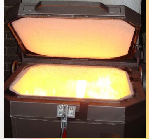
Yüksek Sıcaklıkta Birincil Çember